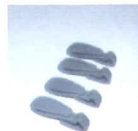
ATTACCHI PORTA LAMPADA FRONTALE